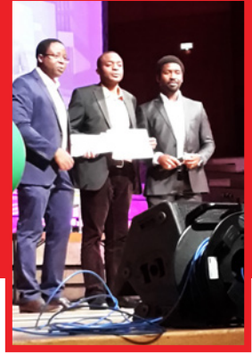
Remise du grand prix du transfert des technologies et de l'excellence PK Fokam à la P7C