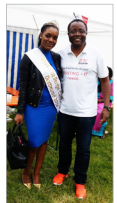
Miss Challenge 2014 en Visite au Stand de la P7C

La P7C profite de cette occasion pour féliciter chaleureusement les organisateurs du Challenge et toutes personnes ou sponsors qui ont concouru à la tenue et au bon déroulement des activités durant cette dernière session. Également, nous adressons nos remerciements à toutes les personnes qui ont visitées nos installations et montrées de l'intérêt pour nos produits et services.